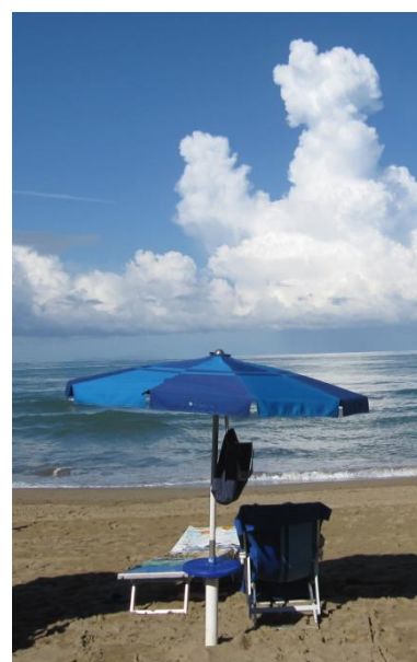
Ferienimpressionen – M&W Dischner