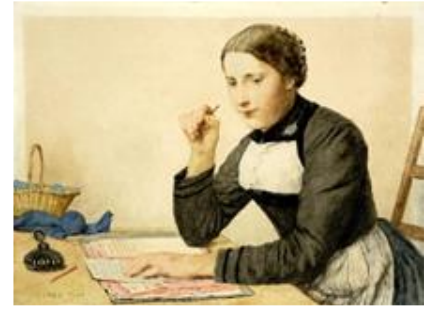
Bild: Albert Anker, Frau am Tisch

Was hat zum Nierenversagen geführt? Welche Nierenersatztherapien hat man mitgemacht? Wie haben sich die Therapien im Laufe der Zeit geändert? Wie hat man mit den kaputten Nieren, der Dialyse, vielleicht der Transplantation gelebt? Gab es besondere Ereignisse, Schwierigkeiten? Ist man in die Ferien gefahren – mit der Dialyse oder transplantiert? Wie ist die Familie, der Arbeitgeber damit umgegangen? Gibt es besondere Tipps, die anderen helfen könnten?